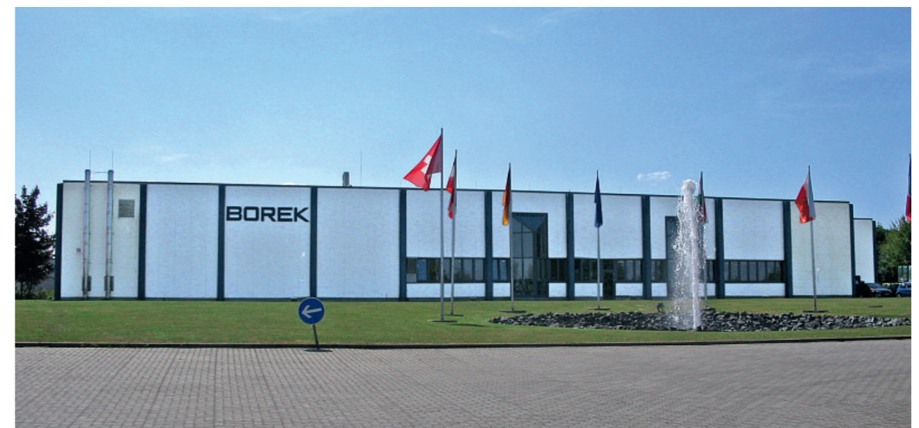
Firmengebäude von Borek media in Osterwieck

Borek media ist einer der maßgeblichen Marketing-Dienstleister Deutschlands. Das mittelständische, inhabergeführte Familienunternehmen bietet seinen Kunden individuelle, auf die jeweilige Branche zugeschnittene Lösungen, an. Ob bei Kommunikationsprojekten, Datenmanagement oder Logistik- und Versandlösungen, Borek media kombiniert in allen Bereichen Erfahrung, Technologien und modernste Fertigung. Das Unternehmen ist an den Standorten Braunschweig, Osterwieck, Lüneburg und Vadodara (Indien) vertreten und beschäftigt ca. 350 Mitarbeiter.