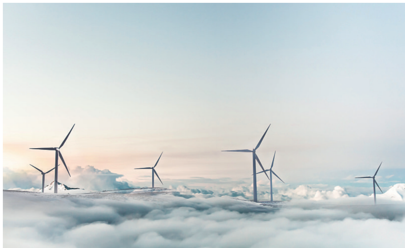
Chancen der Digitalisierung für Energieversorger

Eng mit seiner Heimatstadt verbunden, kümmert sich der Energieversorger darüber hinaus um die Abwasserentsorgung, die Stadtbeleuchtung und Ampelanlagen sowie um den Betrieb bzw. Ausbau von Leitungsnetzen für Strom, Gas, Glasfaser und (Ab-)Wasser. Sein Blick ist fest auf die Zukunft gerichtet. Er investiert u. a. in E-Mobilität, WLAN-Hotspots, energieeffiziente Quartiere und Glasfasernetze. Seiner Verantwortung gegenüber der Umwelt ist er sich – bei allem, was er tut – sehr bewusst. Dementsprechend stammen seine Produkte aus ressourcenschonenden Verfahren.